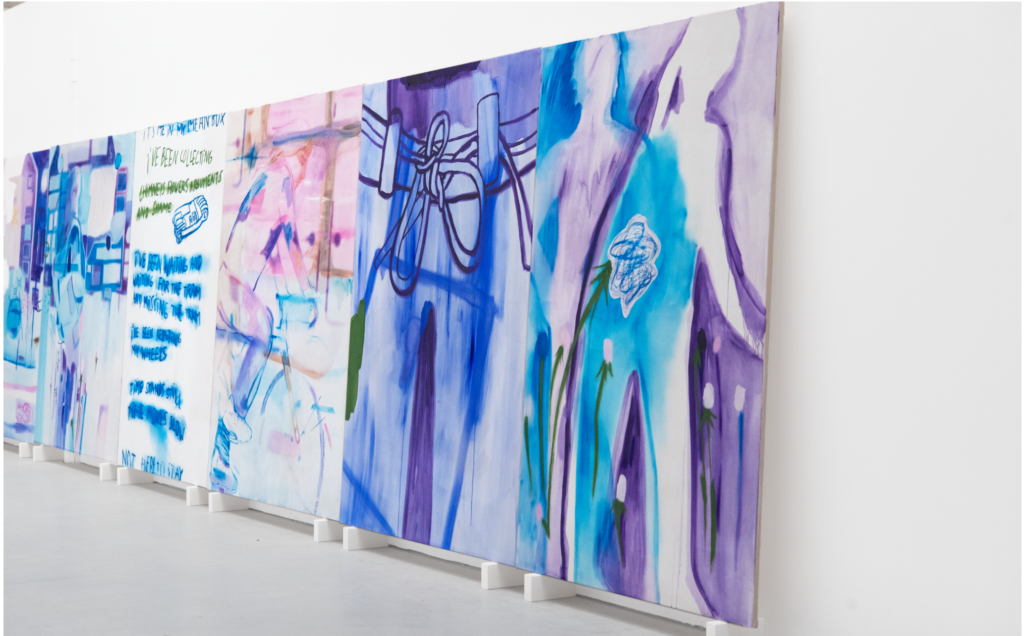
Peintures: „Not allowed“, 2025, 190 x 145 cm, technique mixte sur toile – „Bauchgefühl“, 2025, 190 x 130 cm, technique mixte sur toile.