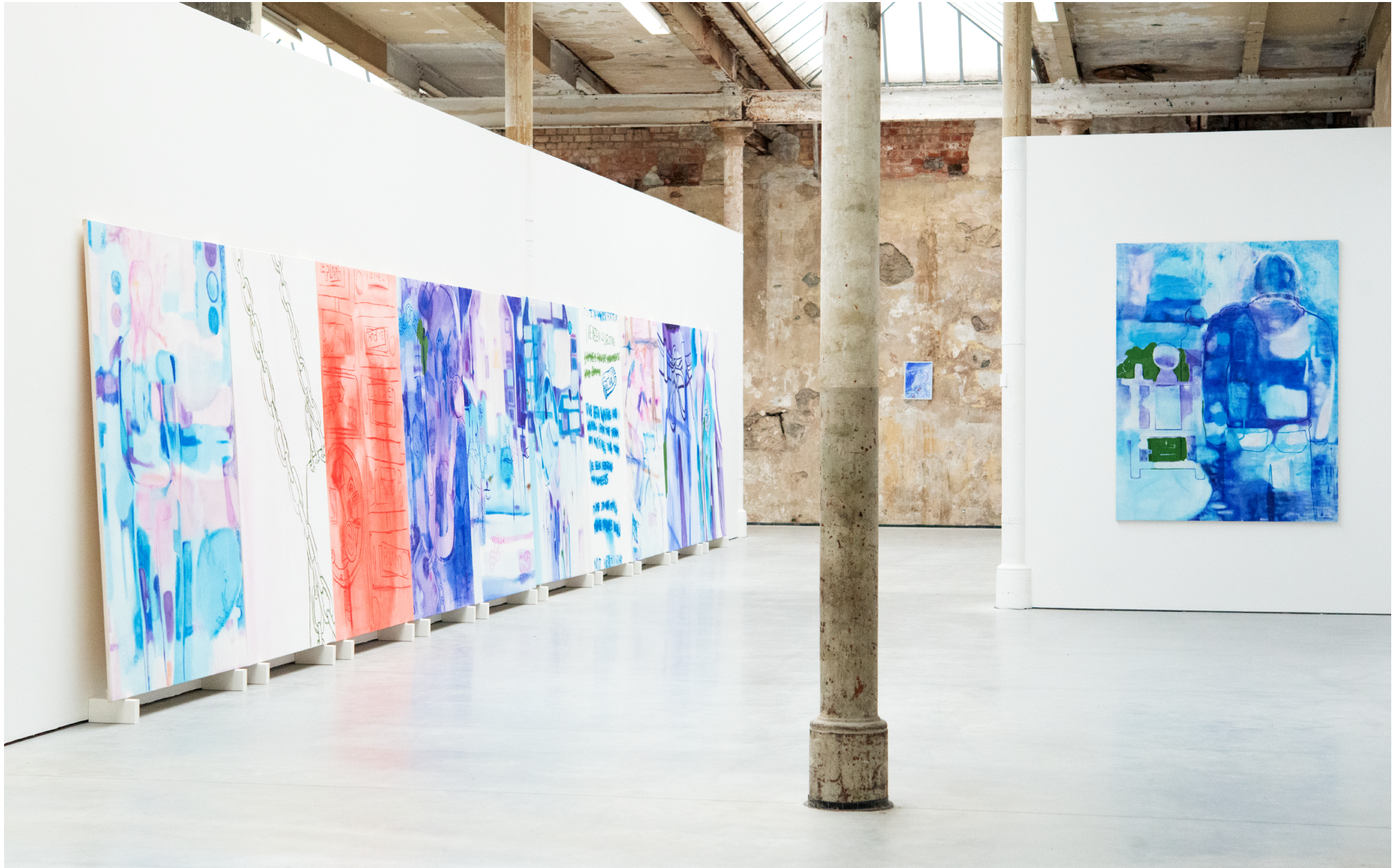
„City Pace“ : Série de dix peintures, 1,90 cm de hauteur, 120 à 140cm de longueur, techniques mixtes sur toile.