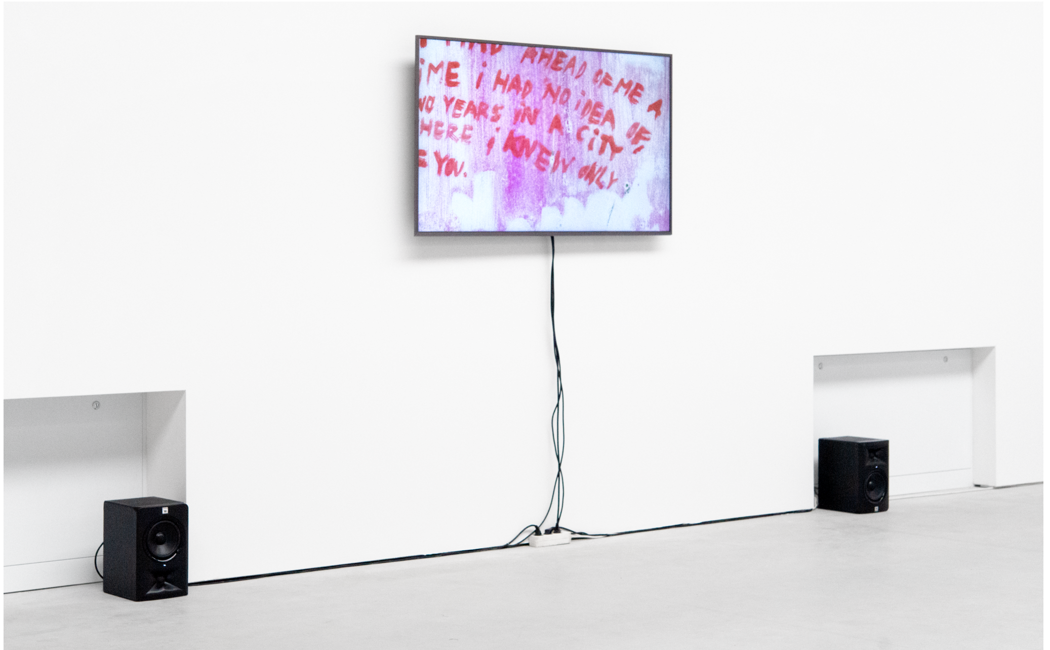
Vidéo: „Knots in my head“, 2025, Animation (Stop-Motion), loop de 2min. Sound design: Farhad Ferzali.