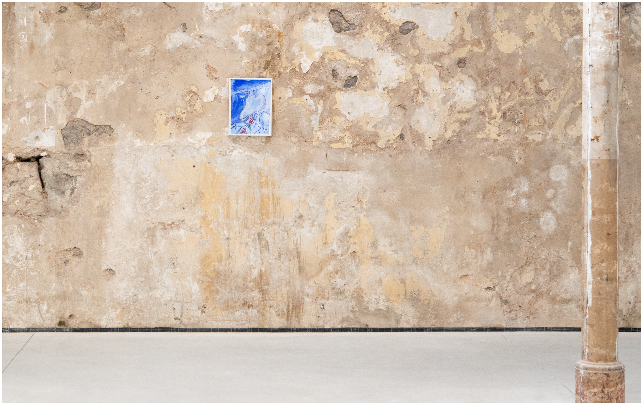
Peinture:: „Miami Vice“, 2024, 29 x 42 cm, gouache sur papier.