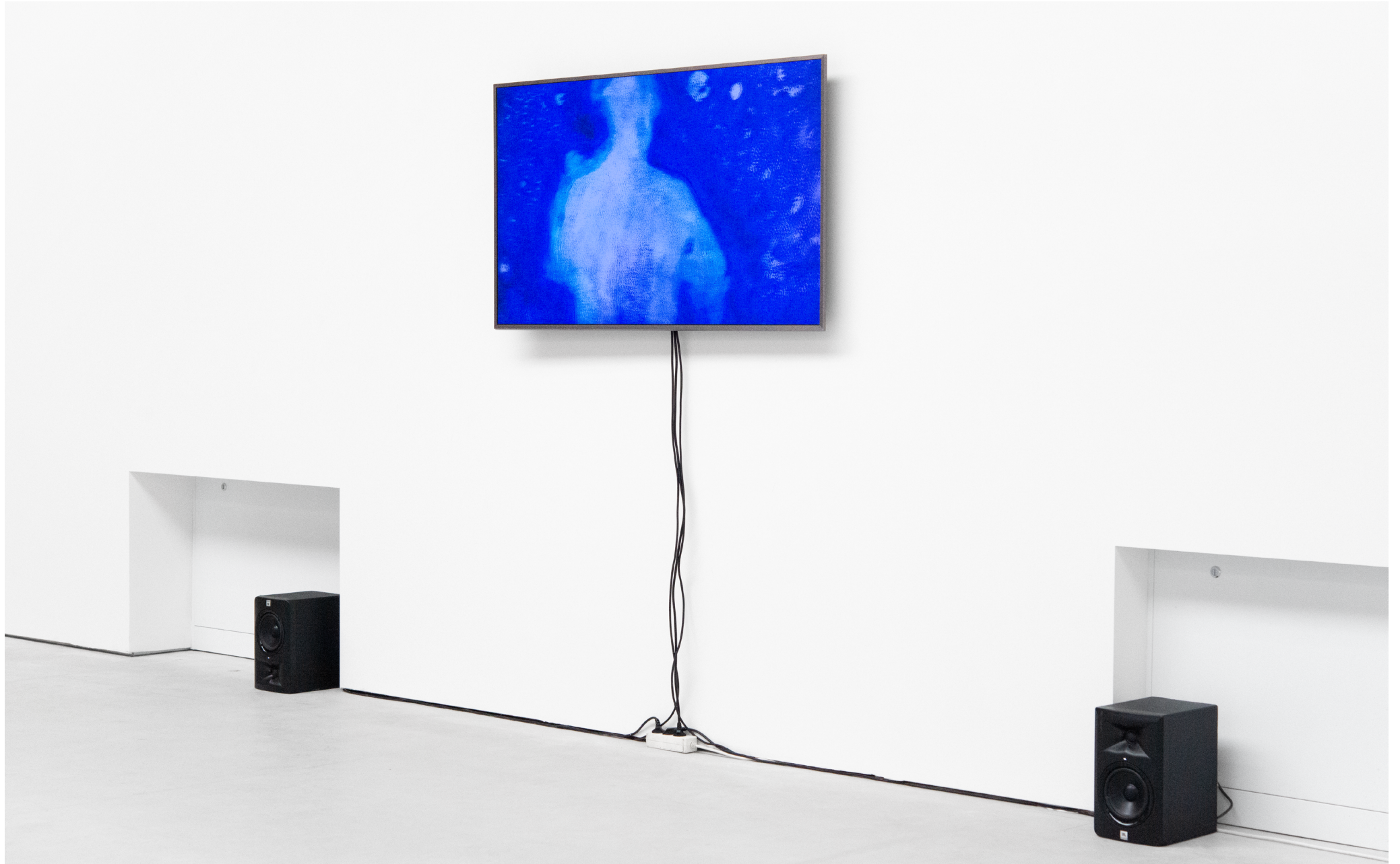
Vidéo: „Knots in my head“, 2025, Animation (Stop-Motion), loop de 2min. Sound design: Farhad Ferzali.