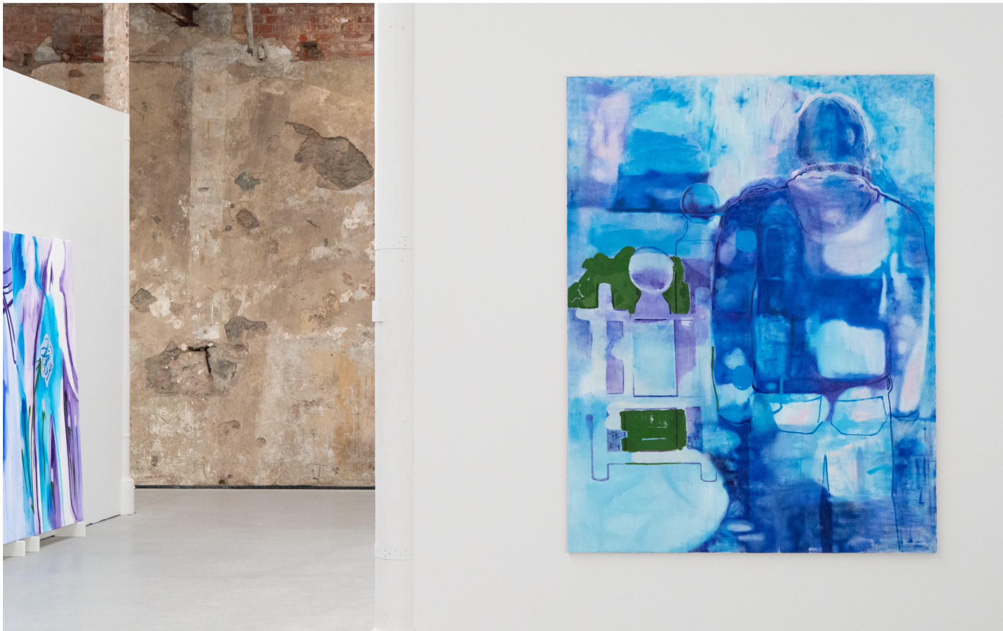
Peinture : „Backstreet end“, 2025, 175x145cm, tempéra et peinture à l'huile sur toile.