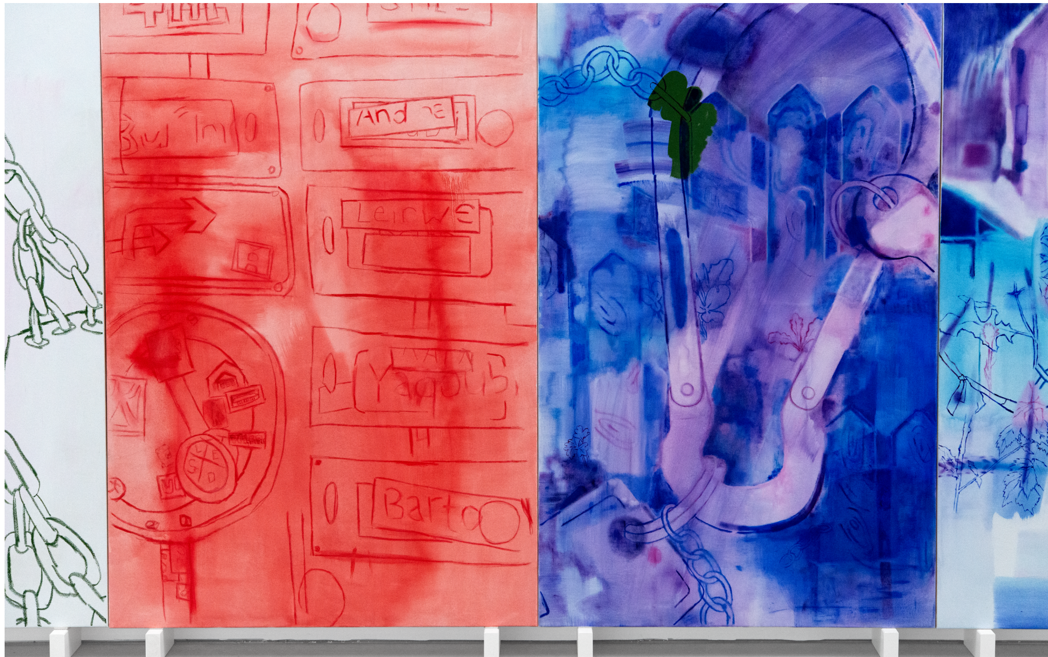
Peintures: „J'attends pour toi“, 2025, 190 x 145 cm, tempéra et pastel sur toile – „Tout était inondé“, 2025, 190 x 130 cm, tempéra et peinture à l'huile sur toile.