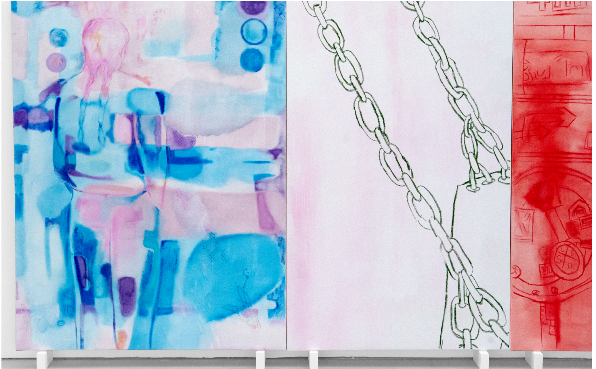
Peintures: „Lost in“, 2025, 190 x 145 cm, tempéra et peinture à l'huile sur toile – „Mood swing“, 2025, 190 x 140 cm, tempéra et pastel sur toile.