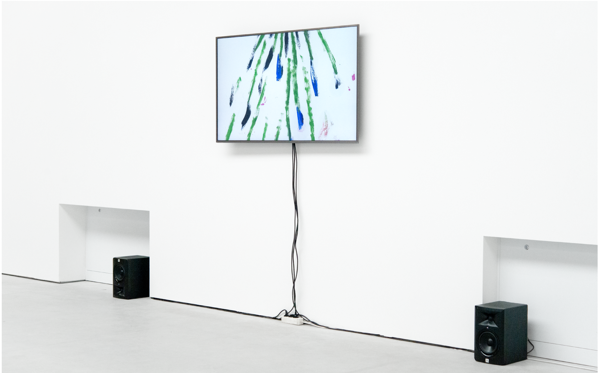
Vidéo: „Knots in my head“, 2025, Animation (Stop-Motion), loop de 2min. Sound design: Farhad Ferzali.