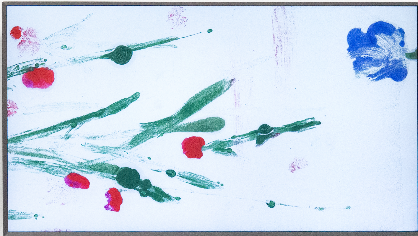
Vidéo: „Knots in my head“, 2025, Animation (Stop-Motion), loop de 2min. Sound design: Farhad Ferzali.